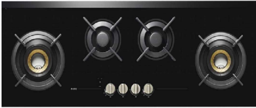
Table de cuisson à gaz 741474 HG8144BGB1