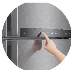
Affichage digital tactile