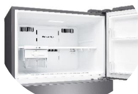
Fabrique à glace Twist Ice™