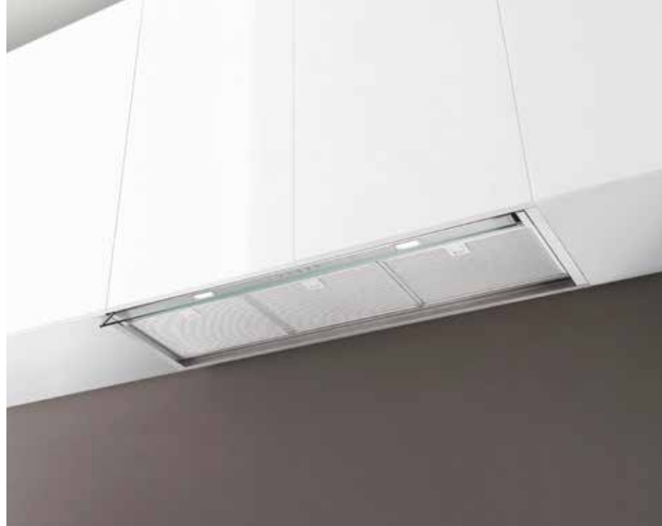
Inox (900 mm)