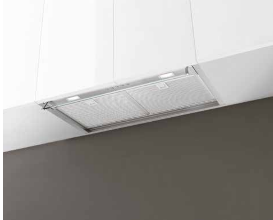
Inox (600 mm)