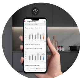
Connectivité LG ThinQ™